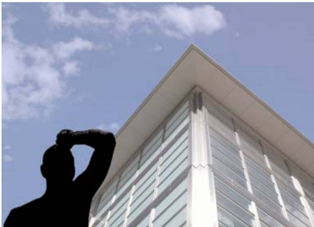
An der ETH Zürich wird die Innovations-Initiative lanciert, mit der man sich neue Forschungsschwerpunkte erhofft.

Im Herbst starten elf neue Bachelor-Master-Studiengänge in Zürich