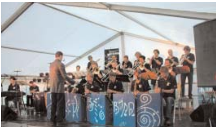
«Jazz im Park». Am ersten Abend des Jubiläums-Festivals begeisterte die ETH Big Band das Publikum im Festzelt bei der Universität Zürich Irchel.

Wenn während der Sommerpause etwas wichtiges passiert, wird «ETH Life» umgehend unter www.ethlife.ethz.ch darüber berichten. Trotz Sommerhitze taucht «ETH Life» also nicht völlig ab. (li/cm)