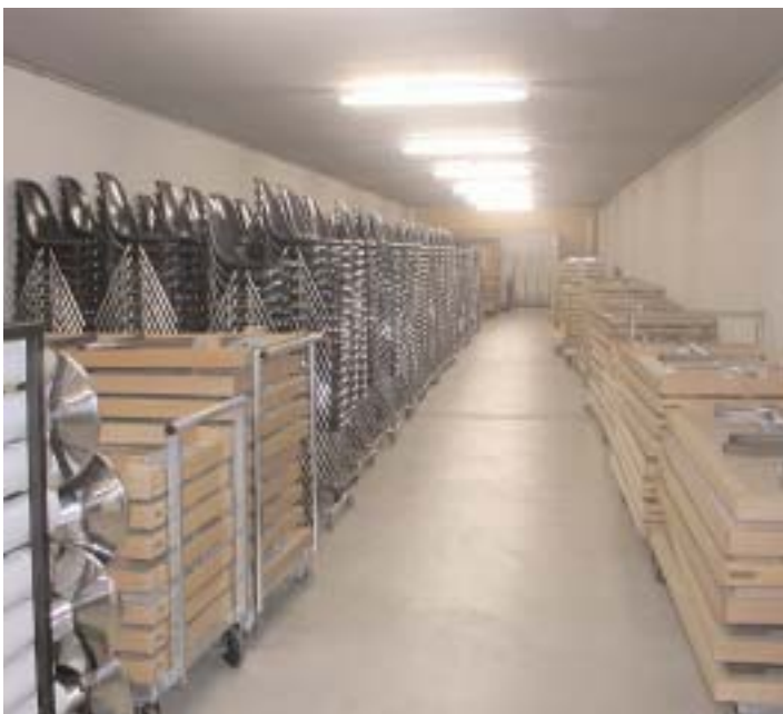
Möbel zum Beispiel sollen im ETH-Bereich künftig nicht mehr einzeln, sondern miteinander zu den günstigsten Konditionen eingekauft werden.

«Insgesamt können wir kurz- und mittelfristig auf über 60 konkrete Verbesserungsmaßnahmen zur Kostenreduktion und zur nachhaltigen Optimierung der Beschaffung in den verschiedenen Warengruppen zurückgreifen», so der Projektkoordinator. Es gehe jetzt darum, an der ETH Zürich ein Institut oder Departement als Pilotprojektspartner zu finden – beispielsweise Physik oder Chemie –, das bereit ist, beim Einkauf von Materialien und Werkzeug in einem Pilotprojekt mitzuarbeiten.