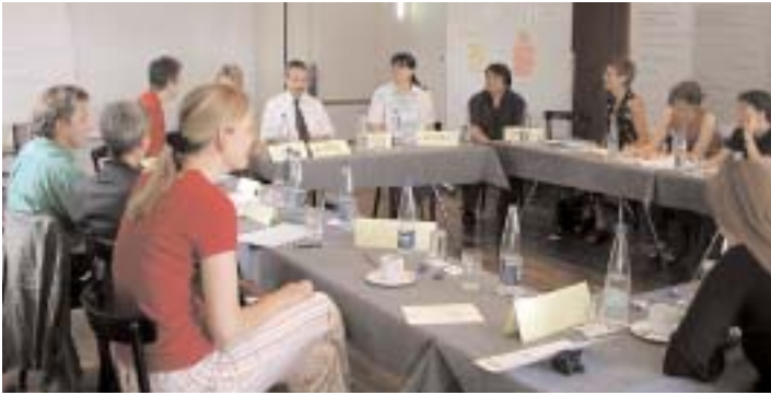
Zum Abschluss der Weiterbildung gab es ein reges Frage-Antwort-«Spiel» zwischen Dozierenden und Doktorierenden.

Mit dem Mentoring-Projekt «Promoting Future» startete die ETH Zürich ein Programm, welches Frauen und Männer für eine akademische Laufbahn begeistern und unterstützen soll: Gruppen von Doktorierenden besuchten Weiterbildungsmodule zu den Bereichen «Standortbestimmung», «Networking» und «Selbstkompetenz». Am Donnerstag, 26. Juni, wurde am Schluss des letzten Moduls, das «Aus», weil die Kosten/Nutzen-Rechnung nicht mehr aufgeht.