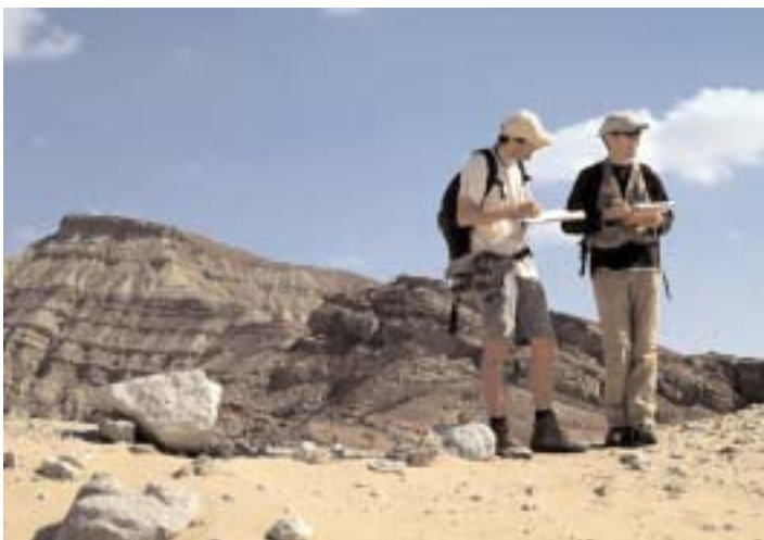
Studenten der Erdwissenschaften bei der Arbeit. Das Fehlen von Böden und Vegetation erlaubt eine 3-dimensionale Sicht der Sedimentformationen.

Leider mussten wir zum Schluss des zweiwöchigen Feldkurses auf die Einladung des ägyptischen Tourismusministeriums verzichten, das uns am Abend vor der Heimreise zu einem Dinner auf einem Nilschiff eingeladen hatte. Zu gross erschienen die Bedenken über die Sicherheit in Kairo. So fuhren wir also früh morgens direkt zum Kairoer Flughafen. Ägypten wäre nicht Ägypten, wenn auf dieser Reise nichts passiert wäre. Gott sei Dank sind Ägypter aber bessere Bastler als Autofahrer. Ein alter Keilriemen, ein Geologenhammer und ein Stück Draht genühten, um unsere Heimreise auch mit gebrochener Achsenfederung sicherzustellen. Was bleibt, sind spannende Eindrücke aus Ägypten, neue Freundschaften und bereichernde Erkenntnisse, möglich geworden durch die grosszügige Unterstützung des Departements.