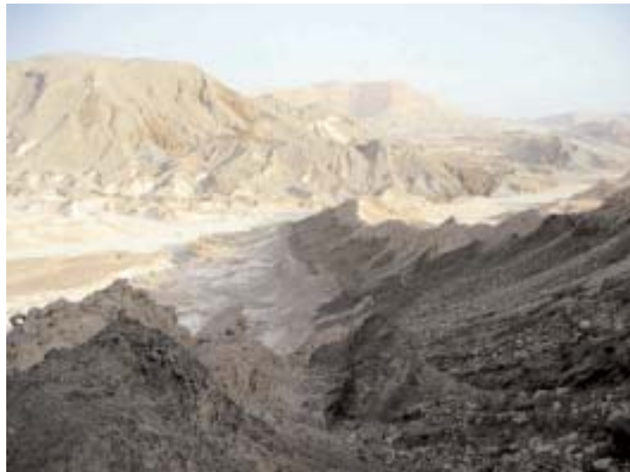
Typische Landschaft auf dem Sinai. Die dunkle, gegen Bildmitte ziehende Fläche ist der Ausbiss eines vertikalen Basaltganges, der während der Dehnung in den Rift eindringen konnte.

In Bussen startete am nächsten Tag die Einführungssekkursion, auf der man sich mit der lokalen Geologie, die zuvor bereits in Publikationen studiert wurde, vertraut machen konnte. Vier einheimische Geologen schlossen sich uns für die nächsten zwei Wochen an. Im Studiengebiet am Rand des Golfes von Suez, einem rund 300 Kilometer langen und 70 Kilometer breiten