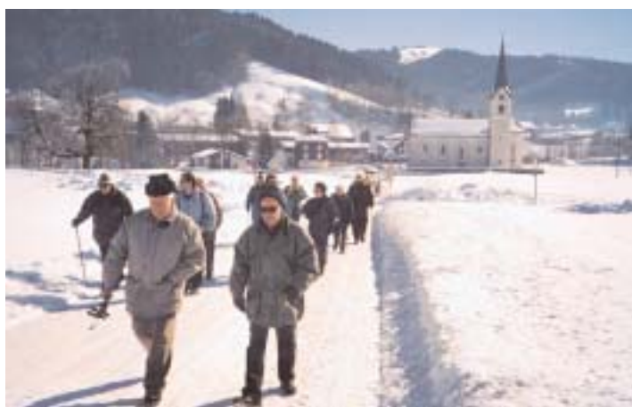
Aufbruch in Egg/Sz.

Nach einem währschaffen Mittagessen wanderten wir bergwärts durch tiefverschneite Felder und Wälder. Bei einem Blick gen Süden erfreute uns das prächtige Alpenpanorama. Auf der Anhöhe angelangt liess sich unter einem Nebelmeer der Zürichsee nur erahnen. In Schindellegi konnten wir den Zug Richtung Zürich besteigen, glücklich und erfüllt von der schönen Wanderung über dem Nebel.